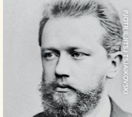
PIJOTR ILJITSJ TSAIKOVSKI